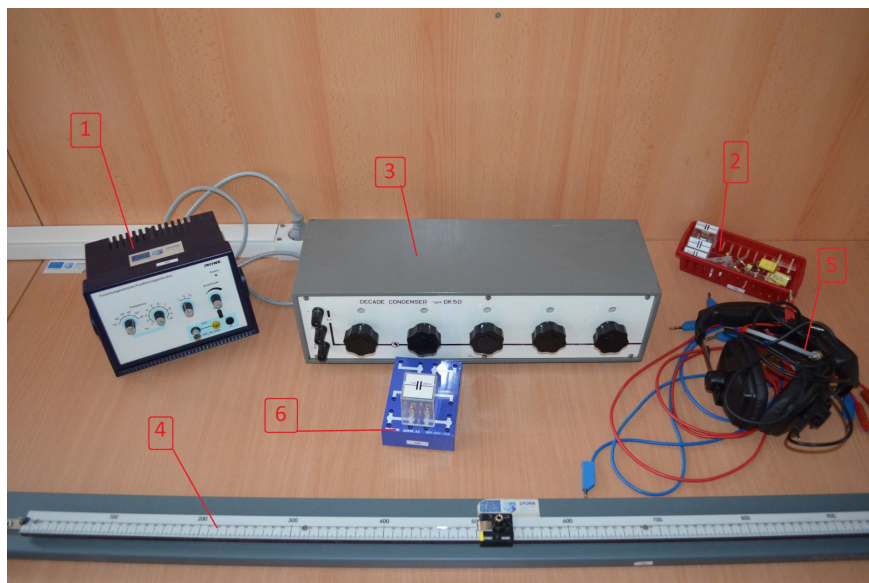
Rysunek E4.2. Zdjęcie układu pomiarowego