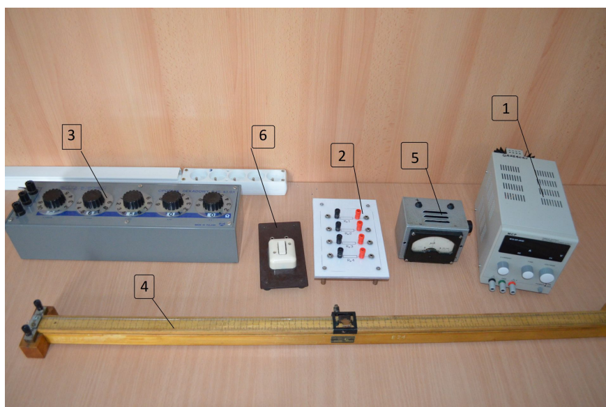
Rysunek E3.3. Zdjęcie układu pomiarowego: zestaw nr 2