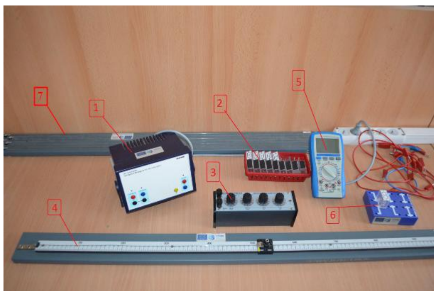
Rysunek E3.2. Zdjęcie układu pomiarowego: zestaw nr 1