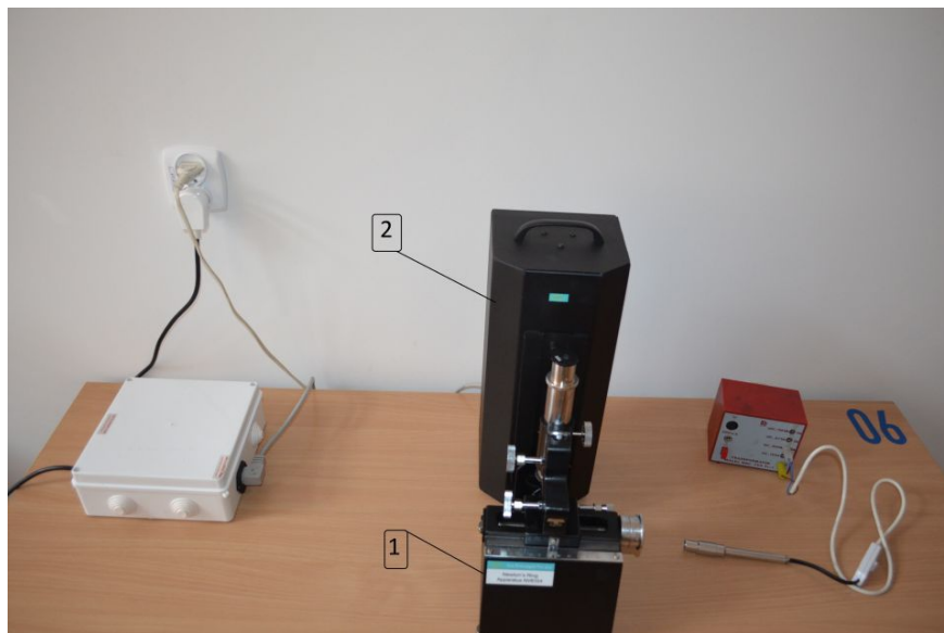
Rysunek O6.1. Zdjęcie układu pomiarowego

Rysunek O6.1 przedstawia zdjęcie układu pomiarowego, który składa się z mikroskopu optycznego 1 , źródeł światła o znanej długości fali 2 , układu płytki płaskorównoległa–soczewka o dużym promieniu krzywizny 3 .