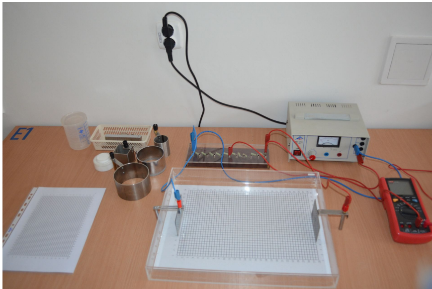
Rysunek E1.2. Zdjęcie układu pomiarowego

nego rozkładu. Takim środowiskiem może być bardzo słaby elektrolit, np. woda wodociągowa, wypełniająca kufkę K . W takiej sytuacji, aby zapobiec procesowi elektrolizy i procesowi powstawania ładunków przestrzennych, przez elektrolit przepuszczamy prąd zmienny o częstotliwości akustycznej, np. 50 Hz. Dlatego też do elektrod E zanurzonych częściowo w wodzie przyłączamy źródło napięcia zmiennego Z i sondą S wyszukujemy punkty o określonej (i tej samej dla danej linii ekwipotencjalnej) wartości potencjału. Miernik uniwersalny mV wskazuje wartość napięcia, które jest różnicą między potencjałem ustawionym na dzielniku oporowym P i potencjałem w danym punkcie pola.